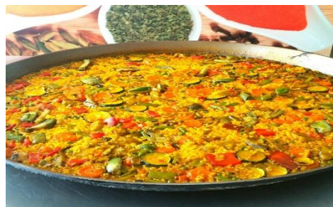
Paella de verduras de temporada