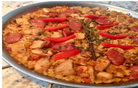
Paella de carne