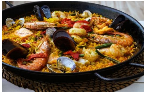
Paella de marisco